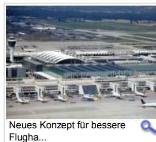
Neues Konzept für bessere Flughaf...

Express-Bahn für München und Verbindungen in Regionen für 1,4 Milliarden Euro Knapp 20 Monate nach dem Aus für die Münchner Transrapid-Pläne dringt Wirtschaftsminister Martin Zeil (FDP) auf eine rasche Umsetzung eines neuen Gesamtkonzepts für eine