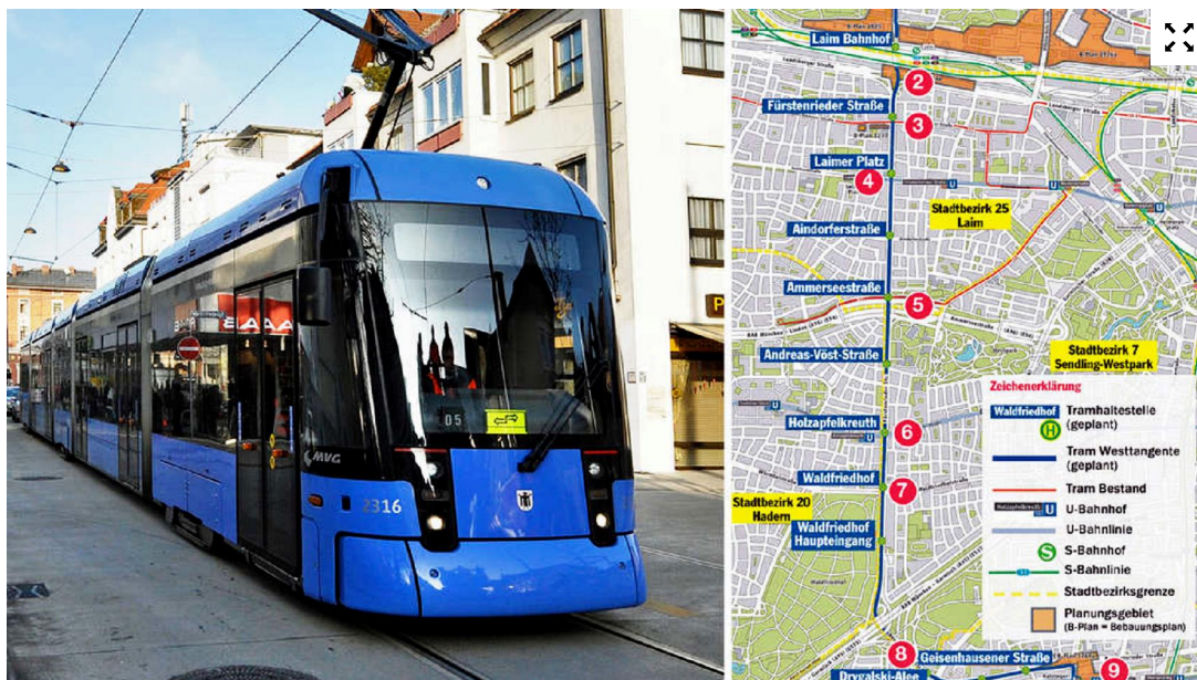
In einigen Jahren soll die Tram vom Romanplatz über Laim, Holzapfelkreuth und Waldfriedhof bis zur Aidenbachstraße fahren.

Teilnahme ab 18 Jahren. Glücksspiel kann süchtig machen. Hilfe unter www.bzga.de . Gewinnwahrscheinlichkeit: 1:95 Mio.