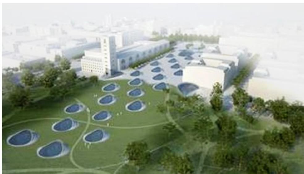
Schlechtes Vorbild hinsichtlich Pleiten und Pannen: Tiefbahnhof Stuttgart 21.

Für Stuttgart-21-Beobachter sind nicht nur die finanziellen und zeitlichen Parallelen, wie sie beim Münchner Tunnelprojekt zutage treten, auffällig. Geradezu ein Déjà-vu erleben Kenner der schwäbischen Prestigeprojekt-Historie, sobald sie die Aussagen der Münchner Tunnelprotagonisten vernehmen. Bisweilen gleichen Versprechen und Eingeständnisse der dortigen Projektpartner – Deutsche Bahn, Bund, Freistaat Bayern und Landeshauptstadt München – bis auf Punkt und Komma den Absichtserklärungen und Widerrufern, die im Laufe des mühsamen Projektfortschritts bei Stuttgart 21 schon verbreitet wurden.